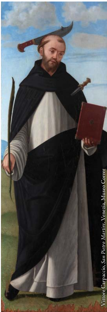
Vittore Carpaccio, San Pietro Martire , Venezia, Museo Correr

Il Trittico di Santa Fosca è stato ricomposto per la prima volta dopo cinquant'anni grazie a Permasteelisa Group