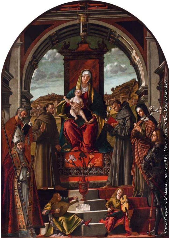
Vittore Carpaccio, Madonna in trono con il Bambino e sei santi , Padova, Museo Antoniano