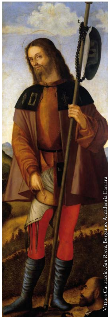
Vittore Carpaccio, San Rocco , Bergamo, Accademia Carrara