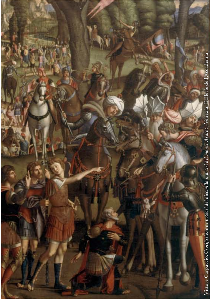
Vittore Carpaccio, Crocifissione e apostosi dei diecimila martiri da monte Ararat , Venezia, Gallerie dell'Accademia