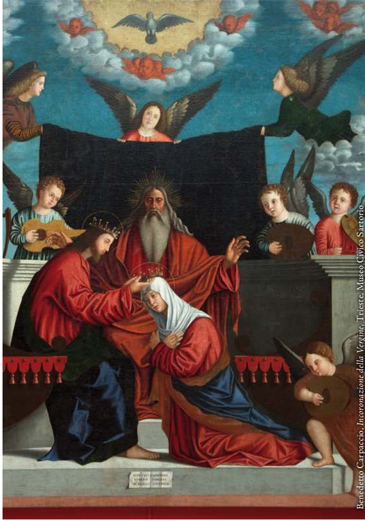
Benedetto Carpaccio, Incoronazione della Vergine , Trieste, Museo Civico Sartorio