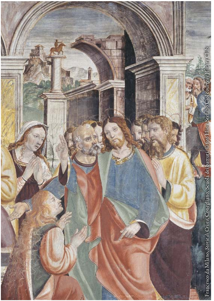
Francesco da Milano, Storie di Cristo , Coreggiano, Scuola dei battuti