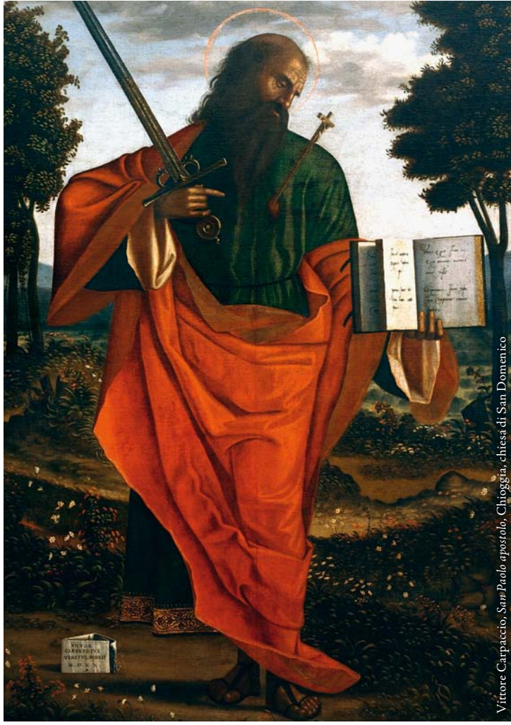
Vittore Carpaccio, San Paolo apostolo , Chioggia, chiesa di San Domenico