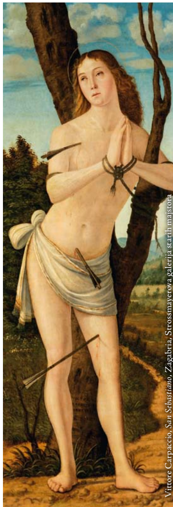
Vittore Carpaccio, San Sebastiano , Zagabria, Strossmayerova galerija starih majstora